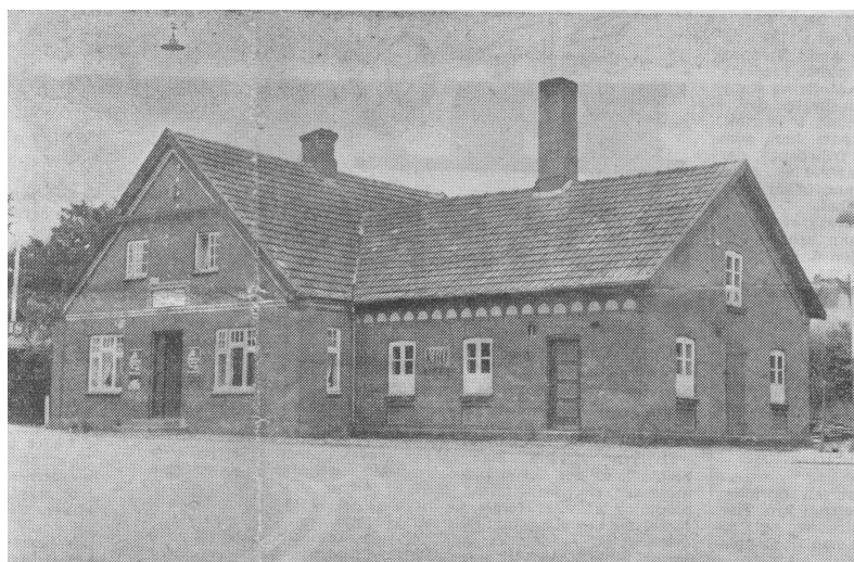
Vejrumbro kro med bageri i tilbygningen.

Fællesskabet mellem landsbyen og kirken er af gammel dato og de fleste forbinder i deres bevidsthed de to ting som noget, der hører sammen. Sådan er det også, når der tales om kroen og landevejen, som i mange tilfælde har forbindelse med en bro. Mange steder i vort land møder man kro og bro sammen som naboer, hvilket er såre naturligt, da strømmen af rejsende nødvendigvis fra begge sider måtte presses sammen til passage over broen, og således skabte betingelse for krohold.