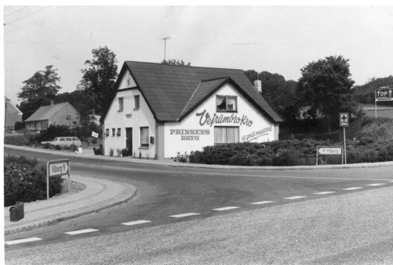
Vejrumbro kro som den så ud i årene efter vejreguleringen og stadig fungerede som kro. Nu er ejendommen helt ombygget.